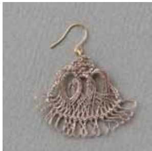
同じ編み図で、ビーズなし、ラメ糸で編んだもの。