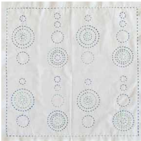
出来上がりサイズ：よこ約 33cm たて約 33cm