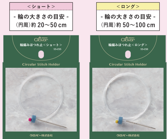
55-235 輪編みほつれ止<ショート> 55-236 輪編みほつれ止<ロング>