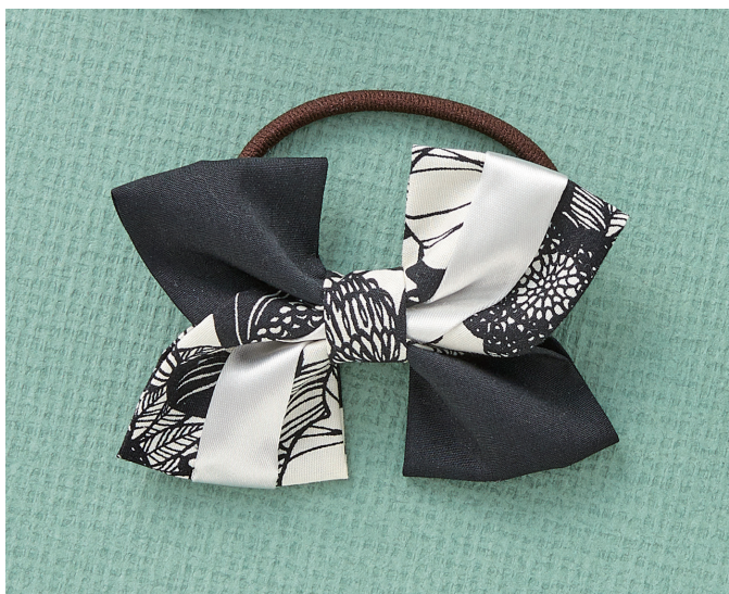
デザイン/パフェプロジェクト神戸 内田 富代 <出来上がりサイズ> (リボン部分のみ) 約6.5×10cm