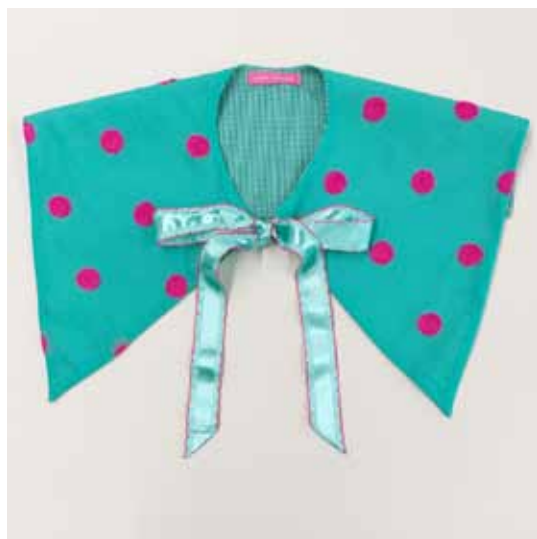
デザイン/指吸快子

※付け襟プレートの使い方と基本の付け襟の作り方は、商品付属の説明書をご覧ください。