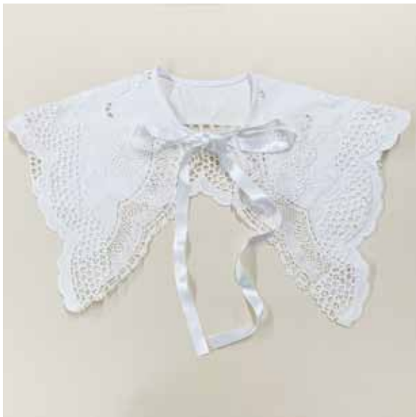
デザイン/マツザワアツコ

※付け襟プレートの使い方と基本の付け襟の作り方は、商品付属の説明書をご覧ください。