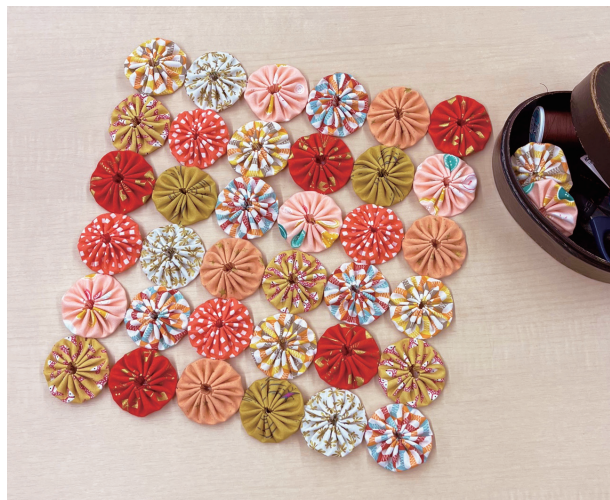
<出来上がりサイズ> 約27×27cm