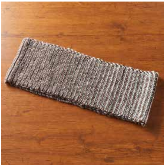
デザイン / atelier K' sK 岡本啓子 出来上がりサイズ：幅 22cm、長さ 108cm ゲージ：10cm×10cm 14目 13段（往復編み）