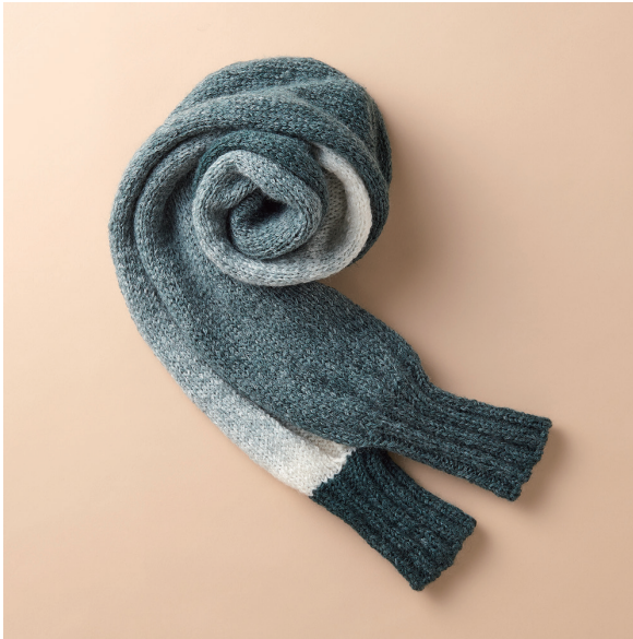
〈デザイン〉 Pikir 佃井フサ子