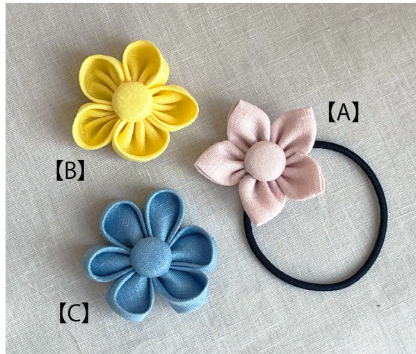
デザイン／クロバー <出来上がりサイズ>約5×5cm※ヘアゴムは含みません