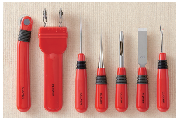
① ② ③ ④ ⑤ ⑥ ⑦