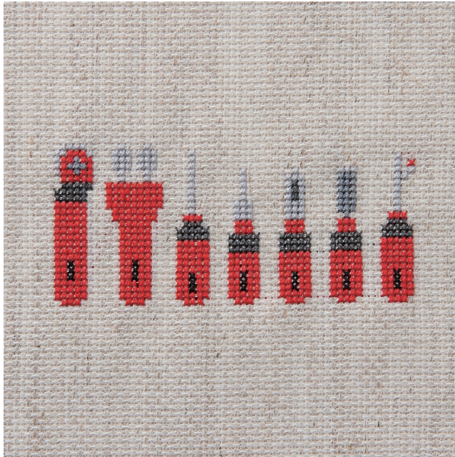
デザイン/クローバー