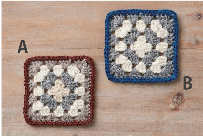
デザイン／梶成子（アトリエ seeds）パフェプロジェクト大阪 できあがりサイズ 約9cm 角