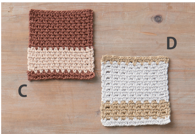
デザイン／梶成子（アトリエ seeds）パフェプロジェクト大阪 できあがりサイズ 約10cm角