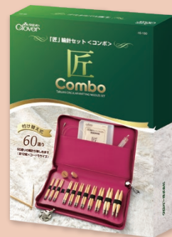
45-150 「匠」輪針セット〈コンボ〉