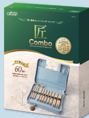
45-151 「匠」輪針セット 〈コンボ・ロング〉

※ 商品の色は、印刷のため実際の色と異なる場合があります ※ パッケージはイメージです