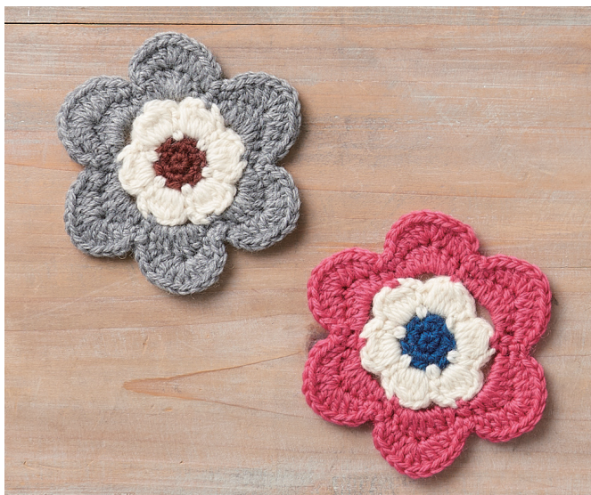
デザイン／梶成子（アトリエ seeds）パフェプロジェクト大阪 できあがりサイズ 約 10.5cm