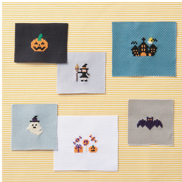
デザイン/クロバー