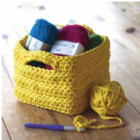
デザイン/しずく堂