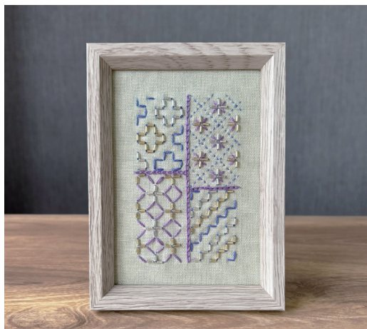
デザイン／クローバー

<作り方> ※ビーズ刺し子テンプレートの使い方は商品付属の説明書をご覧ください。