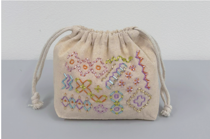
デザイン／米永 真由美 図案サイズ：縦 8cm× 横 12cm

このレシピでは既製品の巾着にビーズ刺し子をしています。 市販の巾着やポーチなど好みのものに刺して楽しんで ください。