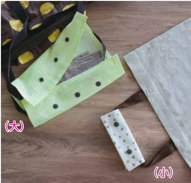
デザイン／クローバー 出来上がりサイズ 広げた状態／ボタンをとめた状態（横×縦） （大）27×32cm／27×11.5cm （小）15×16cm／15×5.5cm